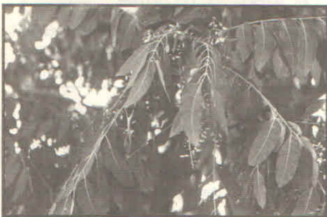
Fig. 2. Rama de cedro rojo en floración.