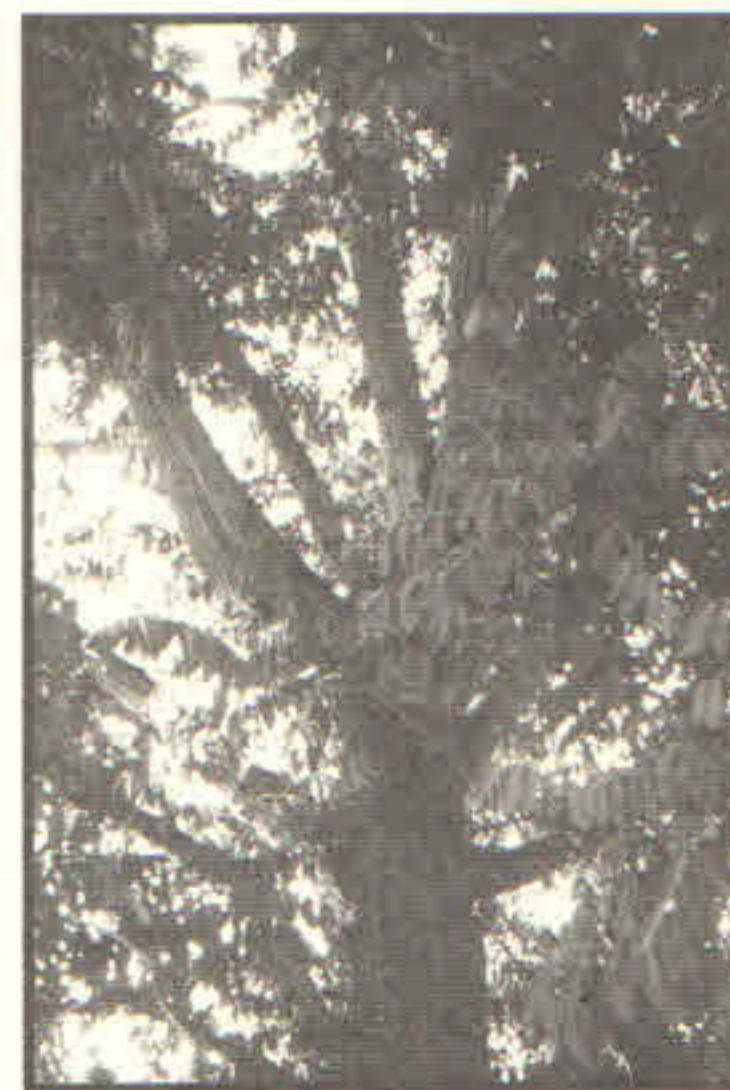
Fig. 1. Árbol de cedro rojo en Llera, Tamaulipas.

El cedro rojo es, sin duda, la especie tropical maderable que más se comercializa y presenta mayor demanda para la elaboración de muebles finos, identificándose en el Estado de Veracruz diversas regiones donde se trabaja este tipo de madera artesanalmente, como Misantla, Juchique de Ferrer, Coyutla, Tlacotalpan, Playa Vicente y los Tuxtlas. En dicho estado, su abasto proviene de bosques naturales en una mínima proporción, la mayoría procede de potreros, fincas cafetaleras y áreas agrícolas (Anónimo 2000). A la fecha sólo cuenta con algunas plantaciones comerciales.