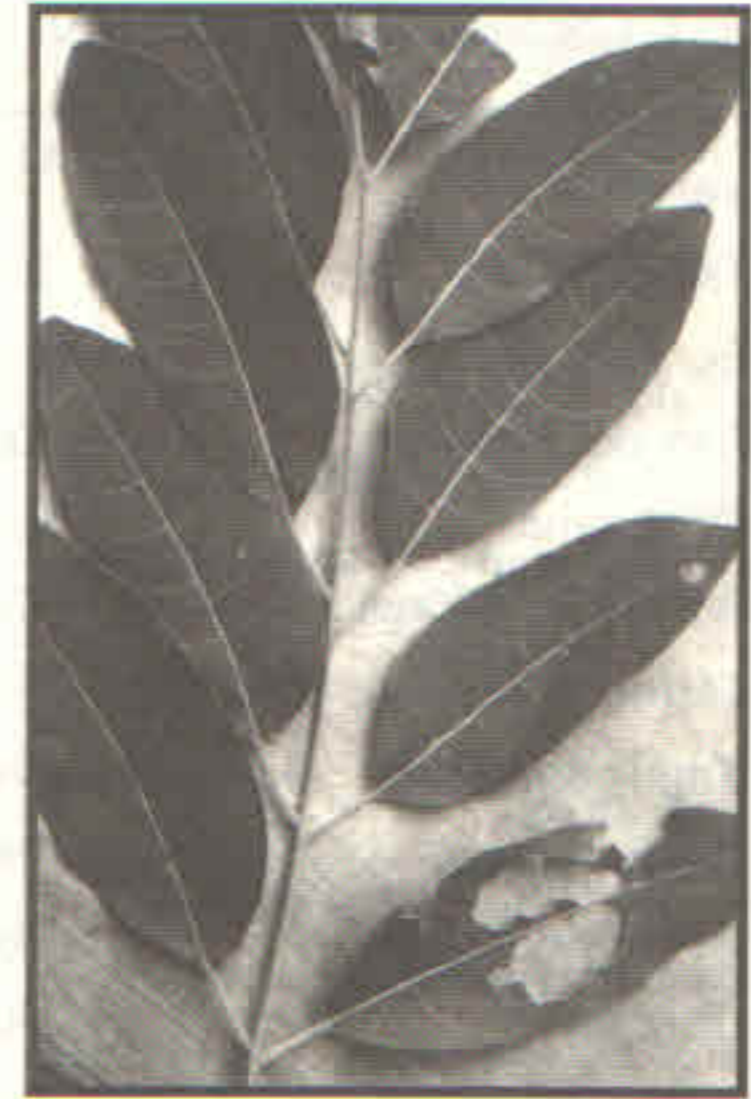
Fig. 3. Hoja de cedro rojo con 10 folíolos, algunos dañados por lepidópteros.

Por su parte, Malda (1990) clasificó a Cedrela odorata como planta rara (de distribución muy restringida) en la zona de Sierras y serranías de Tamaulipas, la cual incluye bosques caducifolios, chaparrales y bosques de coníferas. Solís y Reyes (1998) incluyen a las meliáceas C. odorata y T. havanensis , además de otras 203 especies, en la vegetación secundaria inducida por actividades