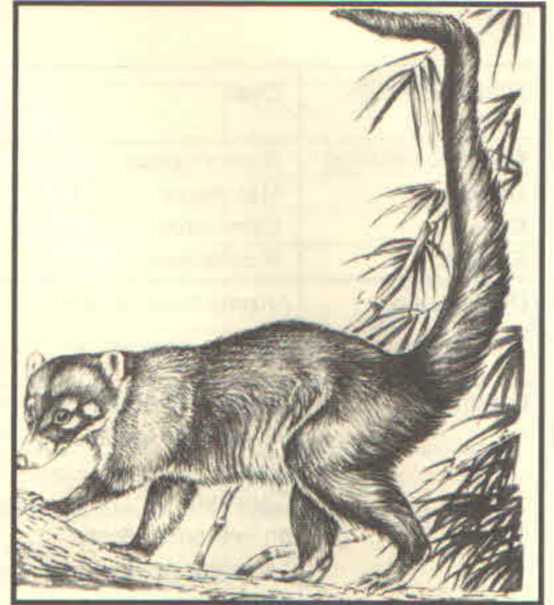
Figura 4. Coatí.

Esperamos que en un futuro próximo se pueda contar con otros lugares educativos y de recreación (con precios aceptables), tales como un Museo de Historia Natural, Parque de Aves, Mariposario, Museo de Arte, etc., donde la población victorense y