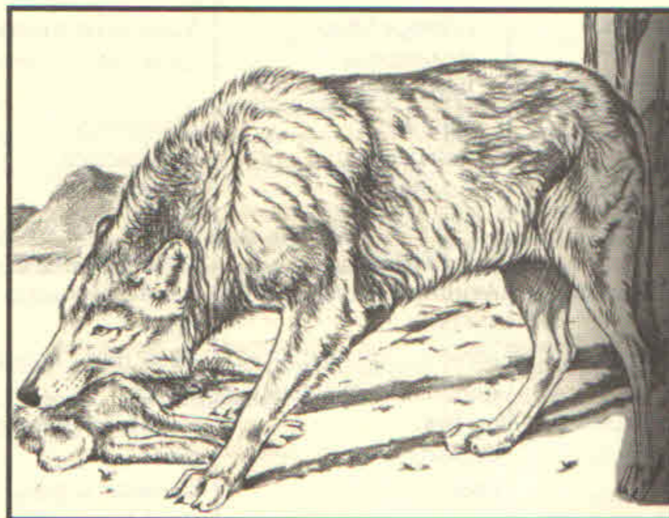
Figura 3. Lobo mexicano – subespecie en peligro de extinción.

Leopold, A.S. 2000. Fauna silvestre de México. Ed. Pax. México. 608 pp + cuadros e índice. (Excelente libro para conocer la distribución de lo que había en México hasta 1959).