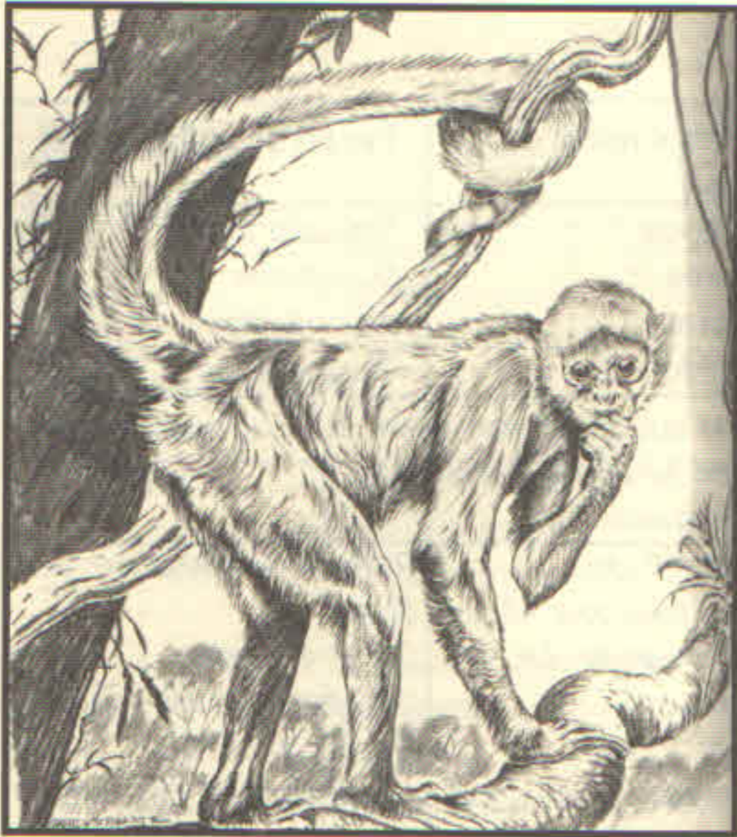
Figura 2. Mono araña.

En Cd. Victoria existen pocos lugares de entretenimiento familiar (Museo de Antropología e Historia, Museo de la Música Popular Tamaulipeca, Teatro Amalia G. de Castillo Ledón, Teatro Juárez, Planetario, ex Asilo Vicentino y el Zoológico Tamatán).