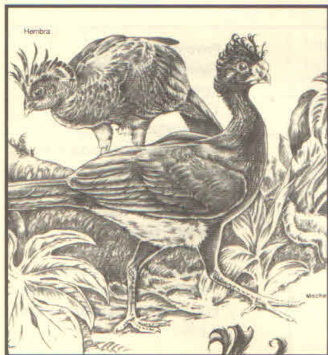
Figura 1. Hocofaisán – presente en la Reserva "El Cielo". Fuente: Leopold (2000).

En México existen grandes zoológicos en varias ciudades grandes (o cerca de ellas), donde se exhiben principalmente animales africanos y unos pocos parques cuentan con mejor representación de la fauna regional, como el Zoológico Miguel Álvarez del Toro en Tuxtla Gutiérrez, Chiapas y el Parque "La Pastora" en Guadalupe, Nuevo León.