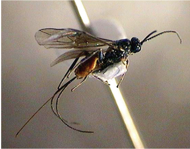
Braconidae con ovipositor largo. Braconidae with a long ovipositor.